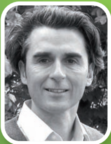
Frank Levita, design3000.de